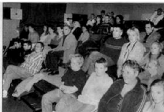
A l'issue du spectacle, un débat s'est ouvert entre l'artiste et les spectateurs.

famille à l'âge de 9 ans, Moussa a découvert un monde nouveau : "J'étais fasciné par la modernité, c'était comme dans un conte de fées", explique-t-il. Et c'est avec les yeux et le langage parfois maladroit d'un enfant que le conteur a souligné les particularités de la France et les souvenirs de ses premières années avec humour mais aussi avec émotion. "Je ne voulais pas faire un one man show, il n'y a pas un rire toutes les deux minutes. Ce sont des