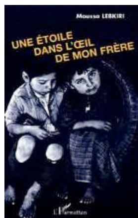
Une étoile Histoires de Kabylie