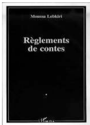
Règlements de contes Contes burlesques