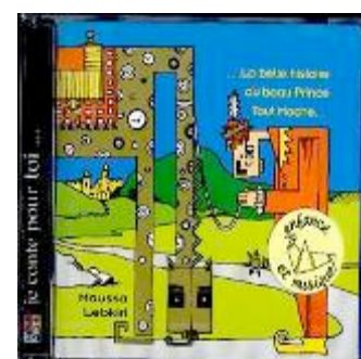
La belle histoire Contes sur CD