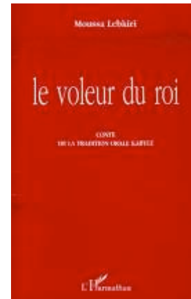
le voleur du roi Contes traditionnels